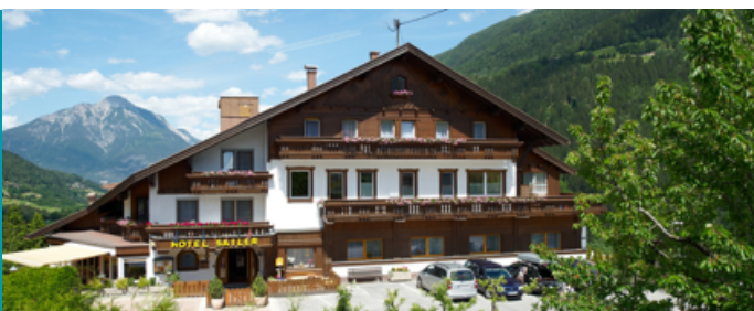
Familotel Sailer *** St. Margarethen 643, 6473 Wenss Tel. +43.(0)5414.87215