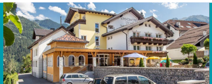
Familotel Stefan **** Unterdorf 52, 6473 Wenss Tel. +43.(0)5414.87215